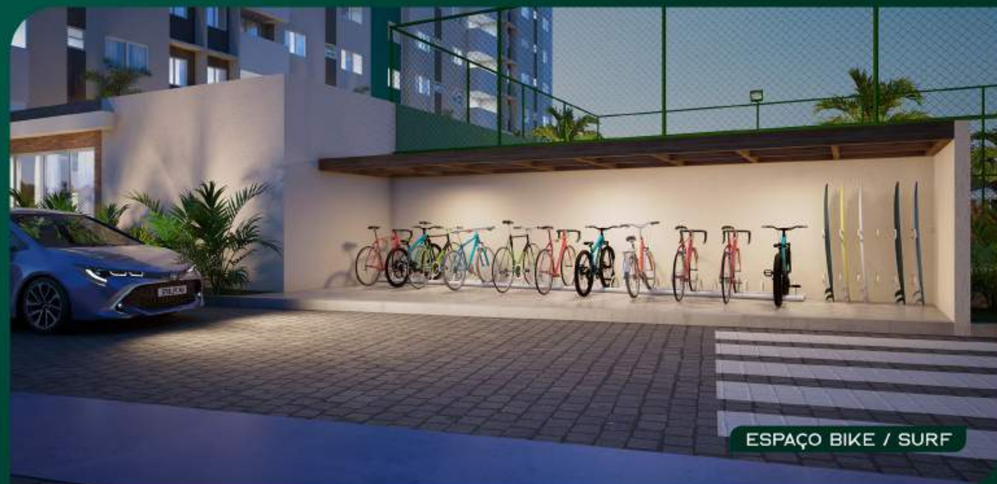
ESPAÇO BIKE / SURF