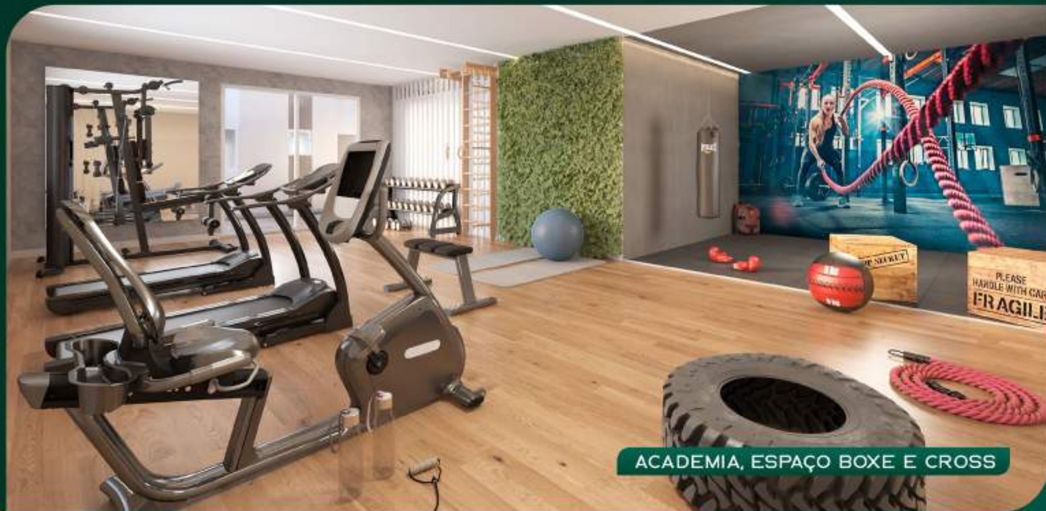
ACADEMIA, ESPAÇO BOXE E CROSS