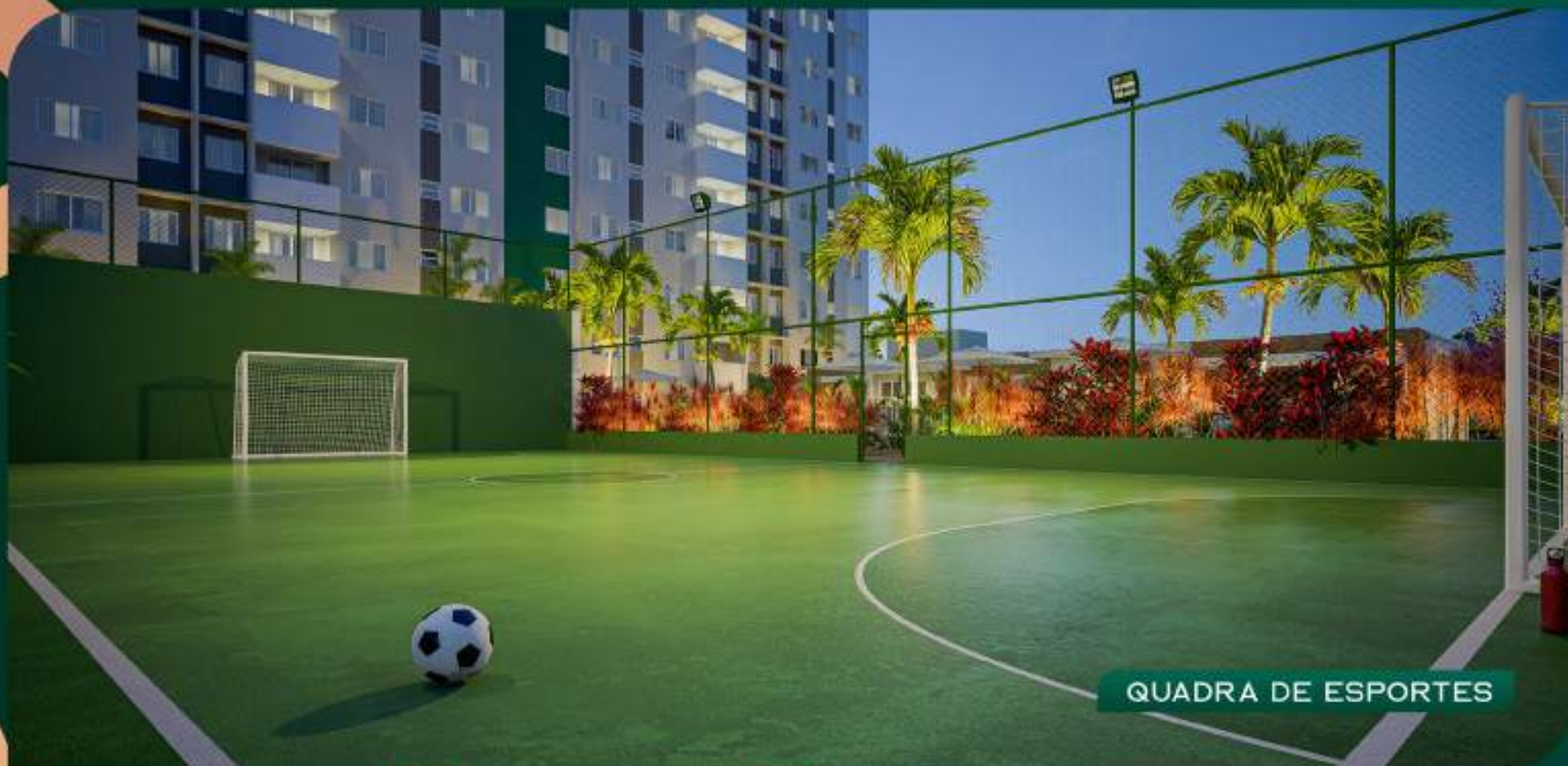
QUADRA DE ESPORTES